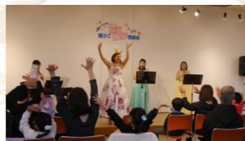
親子でルンルン音楽会 前回写真