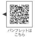
パンフレットは こちら

市内の希望の場所にスポーツセンターより講師を派遣しスポーツを楽しめる事業です。フラダンスやストレッチ、シニア向け講座など様々ご用意しております。市内在住・在学・在勤の5人以上であれば参加可能です。お気軽にお問い合わせください。