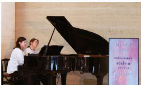
2024年5月14日(火) scale(ピアノデュオ)