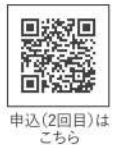
申込(2回目)は こちら

※申し込みは全て先着順です。 ※事業の詳細につきましては、さくらパルホームページをご確認いただくか、またはさくらパルまでお問い合わせください。