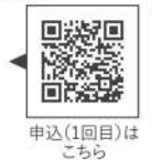
申込(1回目)は こちら

日時:9/1(日) ①13:30~14:20 ②15:00~15:50 対象:市内在住の親子 各回6組 申込期間:8/6(火)10:00~ 8/31(土)17:00まで