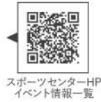
スポーツセンターHP イベント情報一覧

近年注目されている“ブレイキン”の小学生向け短期教室を開催します。 日程:8/24・8/31・9/7・9/14・9/21・9/28(全6回) 時間:すべて土曜日 11:15~12:15 申込期間:7/27(土)~8/10(土) 教室詳細やお申込みは、スポーツセンターホームページよりご確認ください。