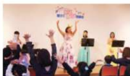
親子でルンルン音楽会 前回写真

買い間違えによる返金はできません。 例①ご家族3名で来場→1ファミリー席 例②ご家族5名で来場→1ファミリー席+1名追加 例③ご家族7名で来場→2ファミリー席 例④ご家族2名×2家族で来場→2ファミリー席