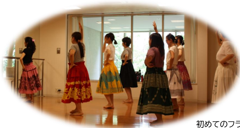
初めてのフラダンスの様子