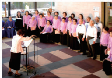
2019年7月28日(日) 出演:宝珠コーラス、コール・セプテンバー