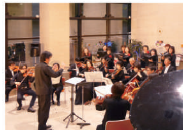
2023年12月3日(日) サロンコンサートvol.74