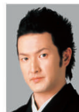
なかむら しどう 中村 獅童